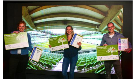
Winnaars Koploperprijs Groningen 2021